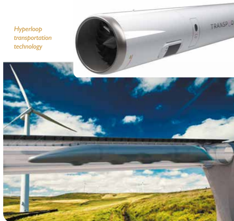
Hyperloop transportation technology

Hyperloop pose des problèmes technologiques « insolubles » mais y ajoute une dimension de complexité géopolitique considérable : l'intérêt de mettre en réseau des villes à une telle vitesse ne se considère qu'à l'échelle continentale, et le déploiement de ce réseau de « tubes » sera donc très long (en France cette idée de voie « au-dessus du